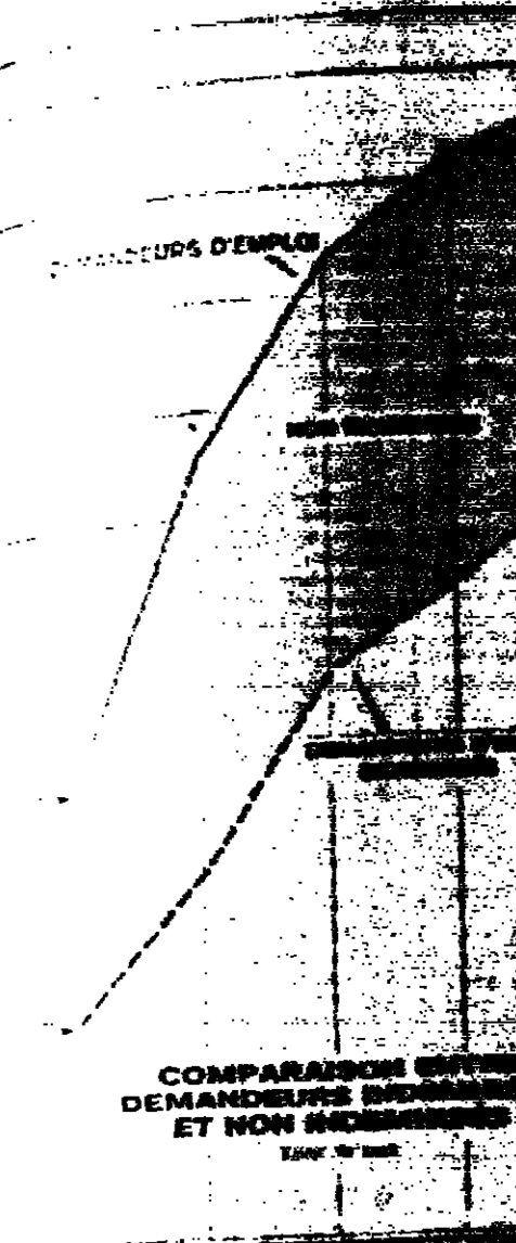
COMPARAISON ENTRE DEMANDE D'EMPLOI ET NON-MARCHÉS